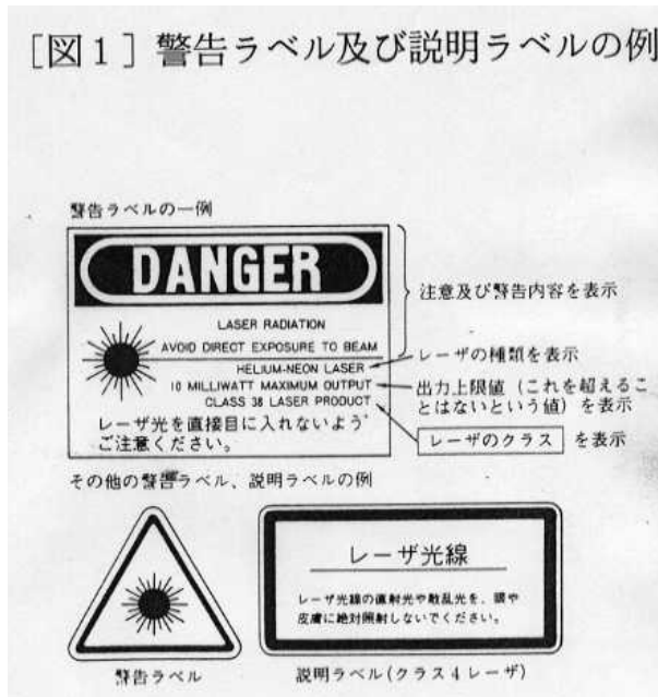
[図1] 警告ラベル及び説明ラベルの例