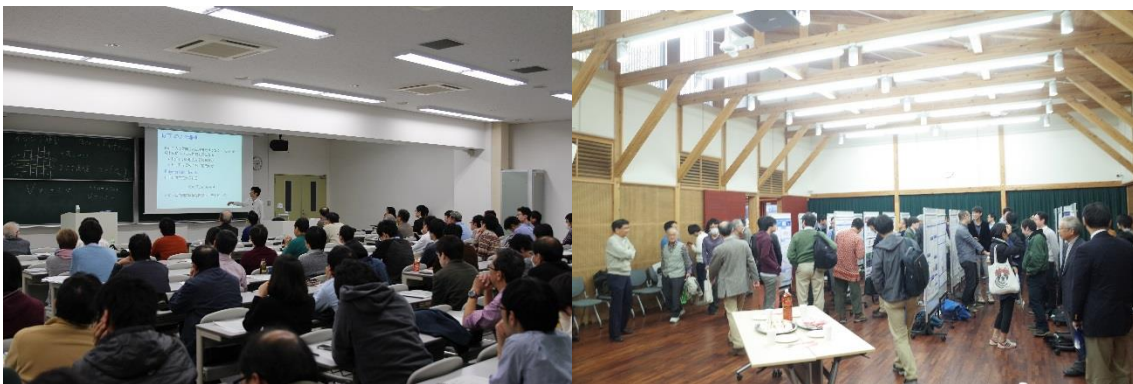
理学研究科基金奨学金受給者による成果発表とポスター発表