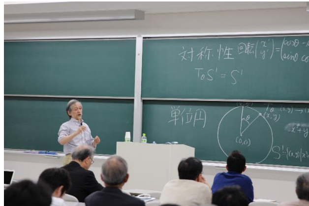
三輪先生による講演

その後、理学研究科セミナーハウスにおいて、理学研究科基金奨学金受給者によるポスター発表と茶話会を開き、後援者の皆様と交流を図りました。