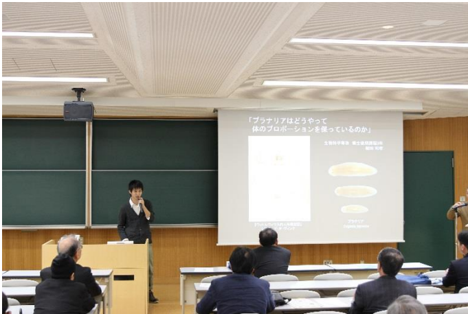
若手研究者による成果発表

また、寄付者の方を対象に、本研究科の施設・研究室の見学会を実施し、理学研究科セミナーハウスにおいて、茶話会を開いて、後援者の皆様と交流を図りました。